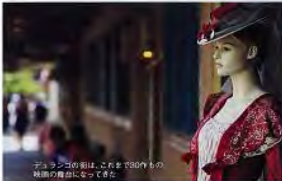
デュランコの面は、これまで80件もの映画の舞台になってきた