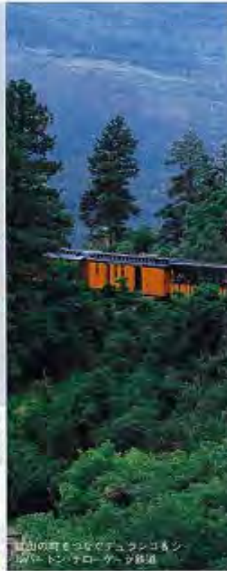
登山の町もついでデュランコからシルバーバートンまで、シロコシ鉄道