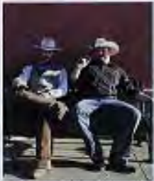
▲夕方、路上で行われるガンブッシュショー。投者は近所のバーテンダー ▶蒸気機関車の始点となる美しい木造の建物が朝日に映えるデュランコ駅